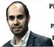
PEDRO FILIPE SOARES LÍDER PARLAMENTAR DO BLOCO DE ESQUERDA

Sabe quais são os crimes que mais matam em Portugal? Para não deixar a imaginação à solta em busca de respostas menos óbvias, vou diretamente aos factos: a violência doméstica é dos crimes que mais matam em Portugal. A morte de mulheres por violência doméstica é uma realidade aterradora no nosso país. A última década mostra a dimensão do flagelo, com mais de 400 mulheres mortas, como se pode constatar no relatório de 2016 do Observatório de Mulheres Assassinadas da União de Mulheres Alternativa e Resposta. É um assunto sério, muito sério. Este não é um assunto só de mulheres, tem de ser de todos nós.