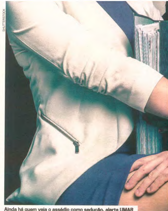
Ainda há quem veja o assédio como sedução, alerta UMAR

Entre 1 de janeiro de 2010 e 31 de dezembro de 2016, a Comissão Para a Igualdade no Trabalho e no Emprego (CITE) recebeu 12 queixas de assédio moral, 30 de assédio sexual e quatro de assédio moral e sexual, números que ficam bastante aquém da realidade de assédio estimada no país. Em 2016, a mesma entidade recebeu quatro queixas relativas a assédio moral e nenhuma queixa relativa a assédio sexual nem a assédio moral e sexual.